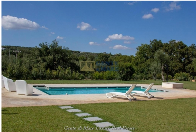
Gente di Mare Luxury Real Estate