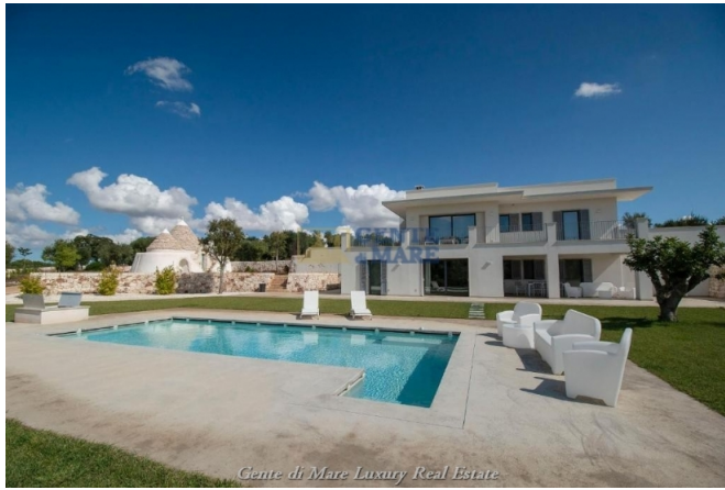
Gente di Mare Luxury Real Estate