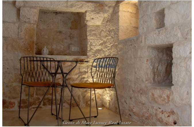
Gente di Mare Luxury Real Estate