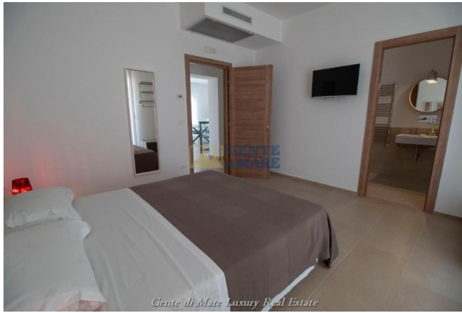
Gente di Mare Luxury Real Estate