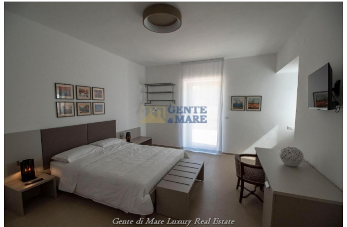
Gente di Mare Luxury Real Estate