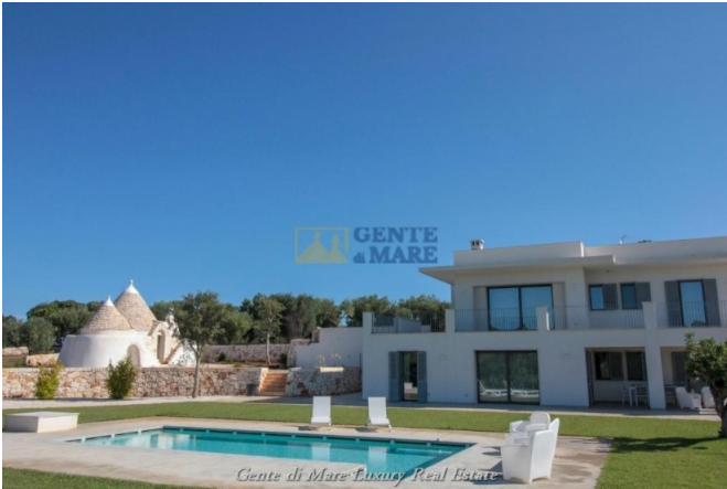
Gente di Mare Luxury Real Estate