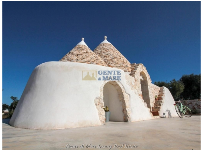
Gente di Mare Luxury Real Estate