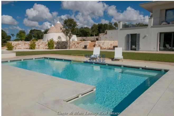
Gente di Mare Luxury Real Estate