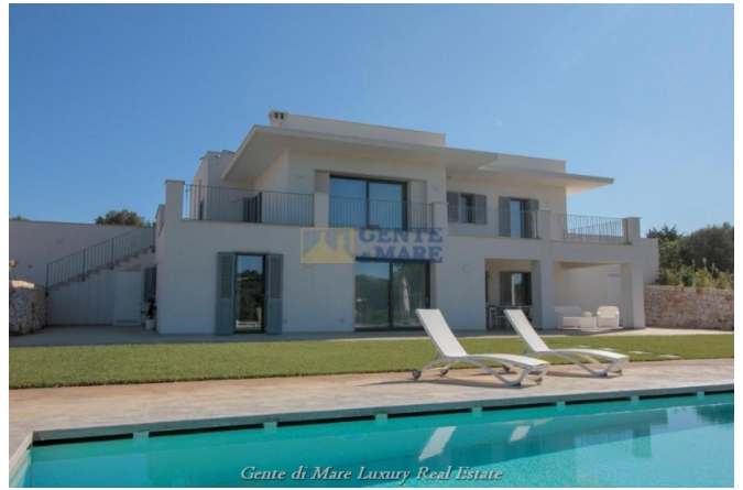
Gente di Mare Luxury Real Estate