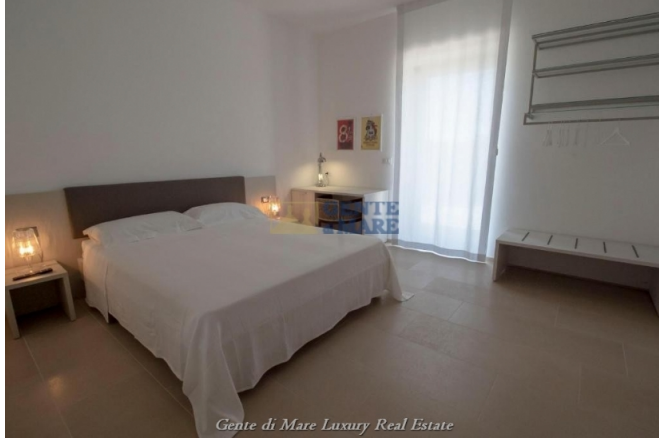
Gente di Mare Luxury Real Estate