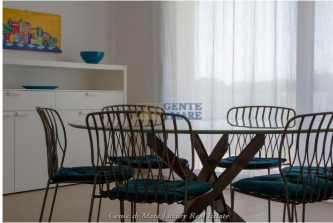
Gente di Mare Luxury Real Estate