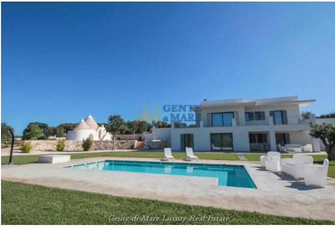
Gente di Mare Luxury Real Estate