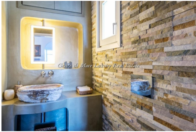
Gente di Mare Luxury Real Estate