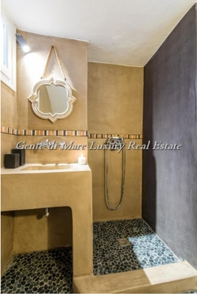
Gente di Mare Luxury Real Estate