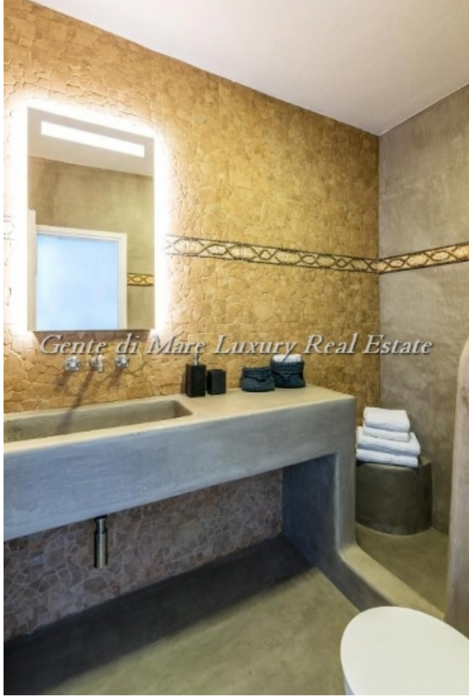
Gente di Mare Luxury Real Estate