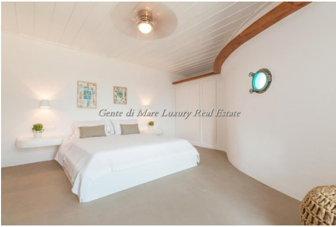
Gente di Mare Luxury Real Estate