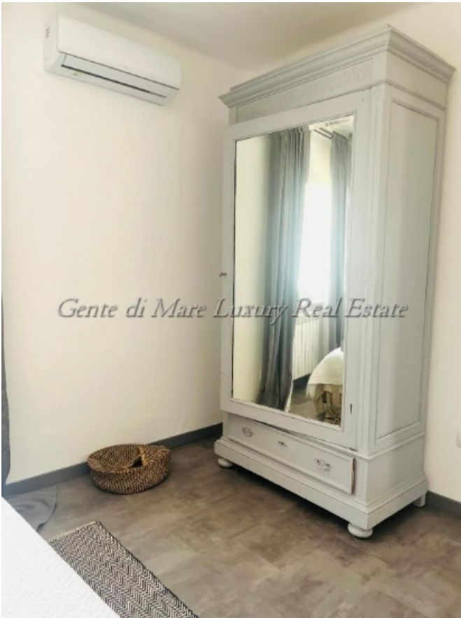
Gente di Mare Luxury Real Estate