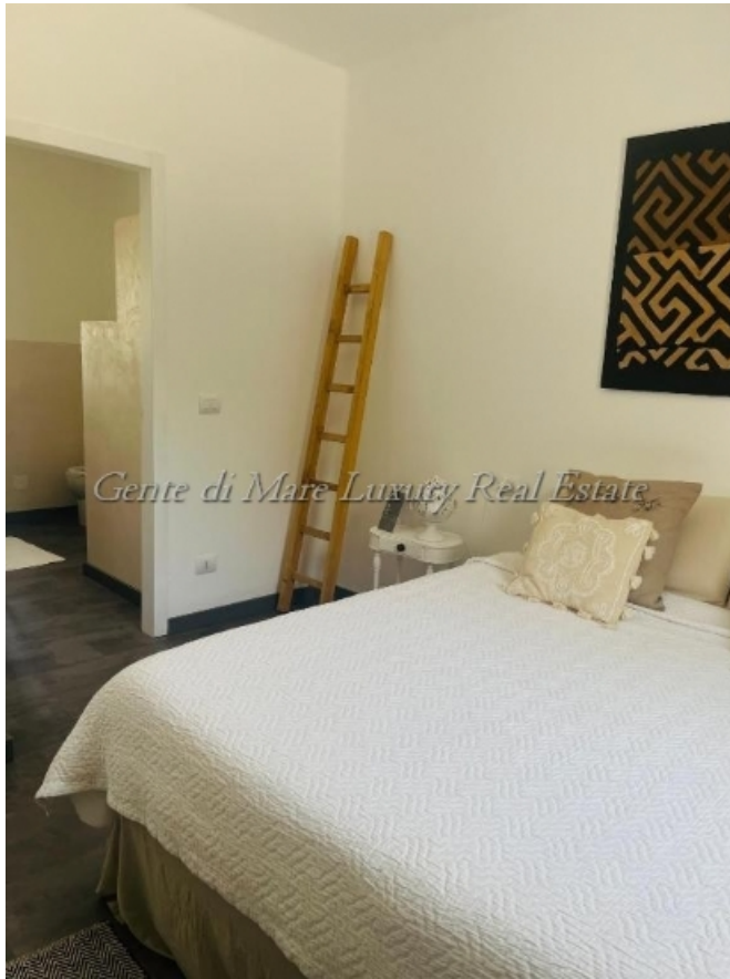
Gente di Mare Luxury Real Estate