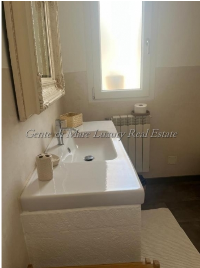
Gente di Mare Luxury Real Estate