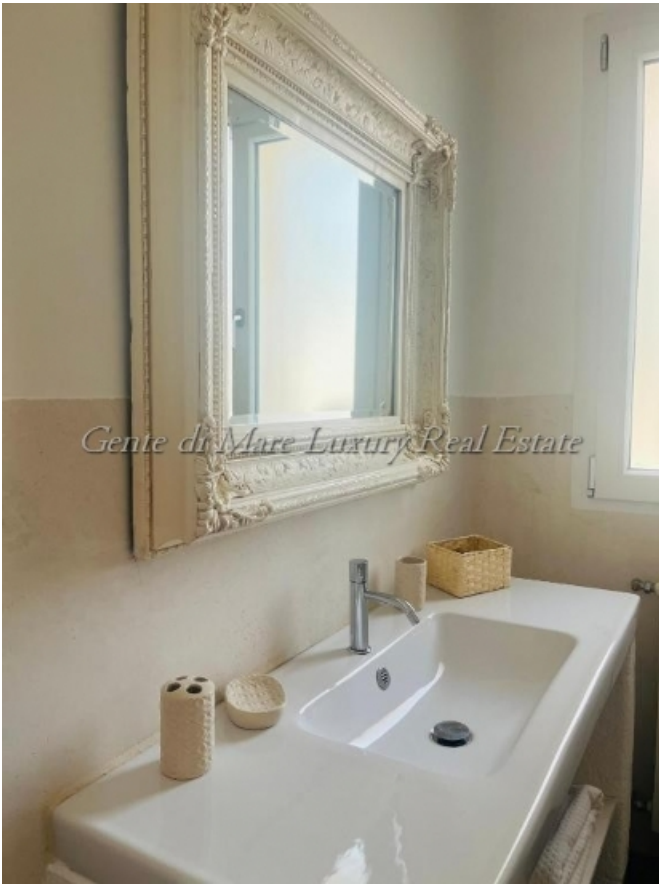
Gente di Mare Luxury Real Estate