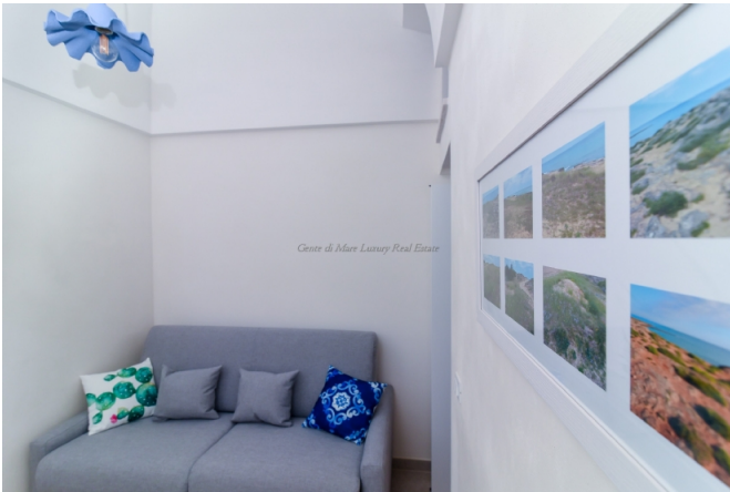
Centre de Masses Luxury Real Estate