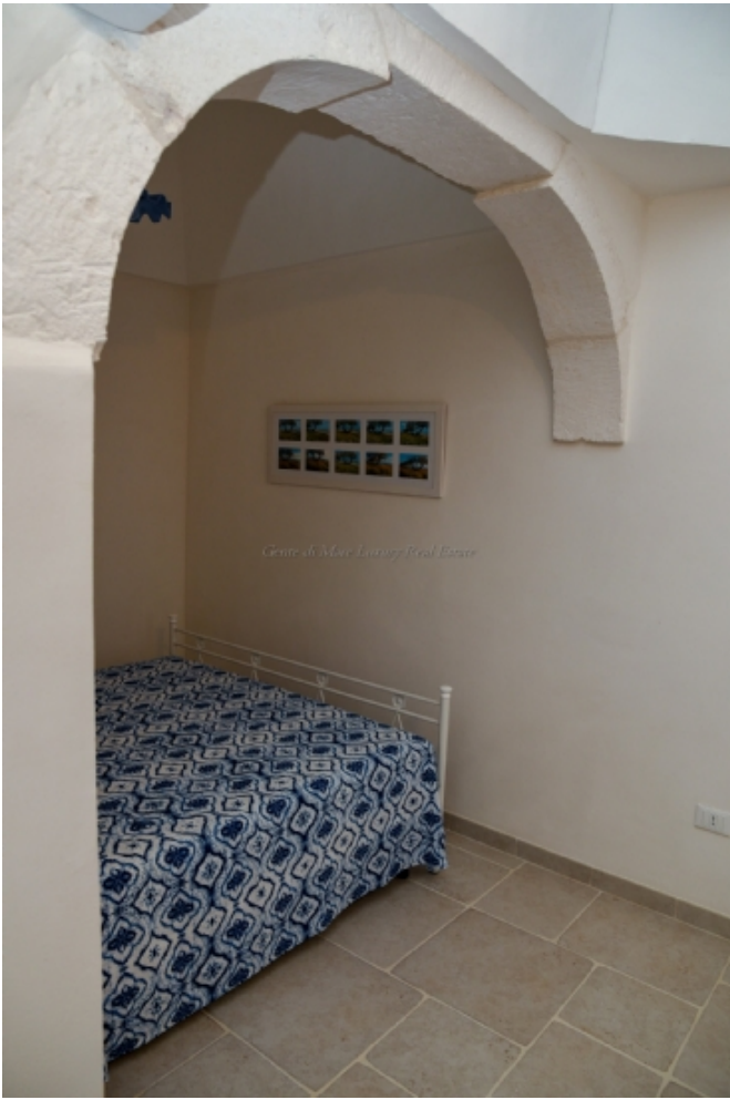
Centre de Masses Luxury Real Estate