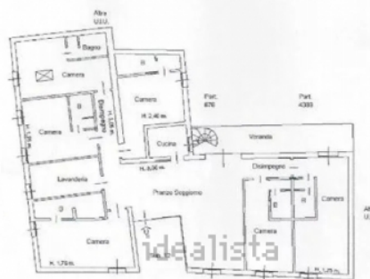
PIANTA PIANO SECONDO